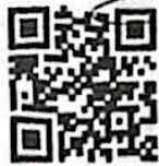
สื่อประชาสัมพันธ์

๑๗๐๓ (คนส่งเอกสาร ห่วงมาใส่) [Signature]