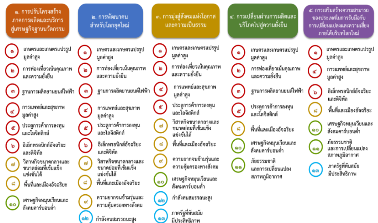
แผนภาพที่ ๓.๑ ความเชื่อมโยงระหว่างหมวดหมู่การพัฒนาที่เป้าหมายหลัก

ความเชื่อมโยงระหว่างหมวดหมู่การพัฒนาที่เป้าหมายหลักแสดงไว้ในแผนภาพที่ 3.1 โดยหมวดหมู่การพัฒนาที่กำหนดขึ้นเป็นประเด็นที่มีลักษณะเชิงบูรณาการที่ครอบคลุมการพัฒนาตั้งแต่ในระดับต้นน้ำจนถึงปลายน้ำ และสามารถนำไปสู่ผลพัฒนาทั้งในมิติเศรษฐกิจ สังคม ทรัพยากรธรรมชาติและสิ่งแวดล้อมไปพร้อมๆ กัน ทำให้หมวดหมู่แต่ละประการสามารถสนับสนุนเป้าหมายหลักได้มากกว่าหนึ่งข้อ นอกจากนี้การพัฒนาภายใต้แต่ละหมวดหมู่ไม่ได้แยกขาดจากกัน แต่มีการสนับสนุนหรือเอื้อประโยชน์ซึ่งกันและกัน